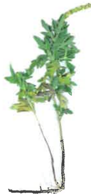
Ambrosie à épis lisses ( Ambrosia psilostachya )