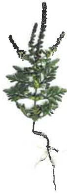
Ambrosie à feuilles d'armoise ( Ambrosia artemisiifolia )